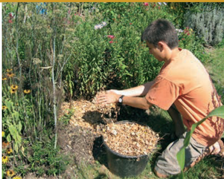
Paillis de feuilles d'accacia

Il est utile de décompacter la terre (enfoncez une fourche à bêcher dans la terre) et d'épandre du compost en surface (1 kg/m 2 ) avant d'installer le paillis.