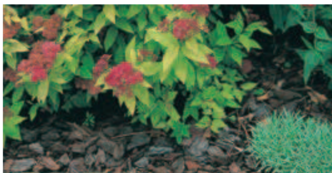
Écorces de pin