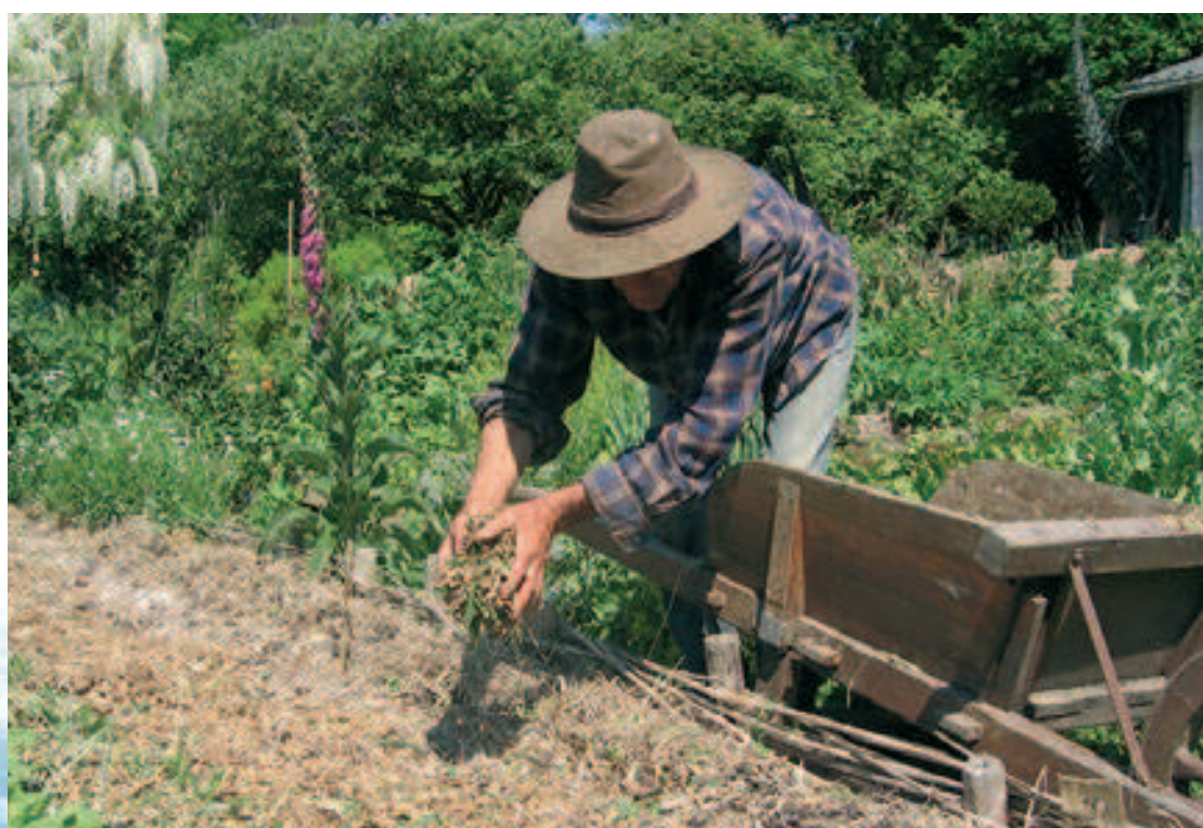
Paillis de végétaux broyés

Comme dans la forêt couverte de feuilles mortes, la terre du jardin reste fertile et les plantes gardent toute leur vitalité. En effet, le paillis favorise la vie biologique du sol, la formation d'humus et le travail des vers de terre. Le résultat est spectaculaire sur la santé et la croissance des plantes.