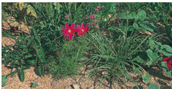
Paillettes de lin