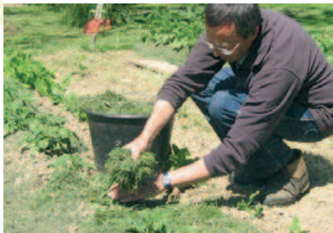
Paillis de tonte de pelouse